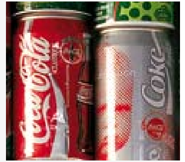
Wer mischt die beste Cola_

Schürze und Stoffbeutel mitbringen dienstags, mittwochs und freitags!!!