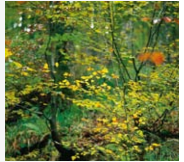
Die Schichten des Waldes