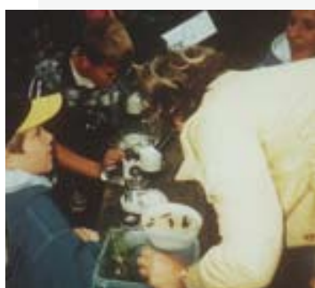
Arbeiten mit dem Mikroskop