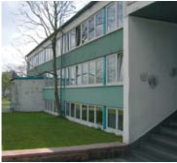
Die Ökoschule in der ehemaligen Sekundarschule Karl-Marx

Die Ökoschule ist in drei Bereiche gegliedert: