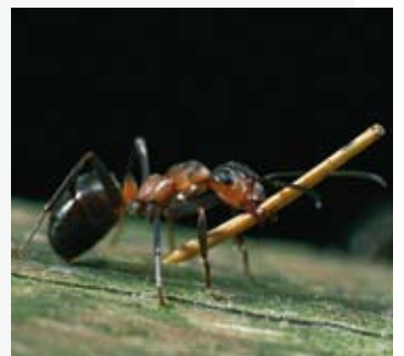
Das Leben der roten Waldameise