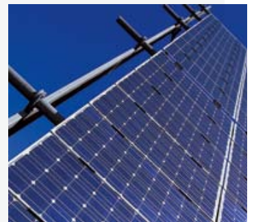
Alternative Energien, Solartechnik